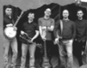
Grass Device (SK)

LOCATION - SUN ROOM | OREA HOTEL PYRAMIDA