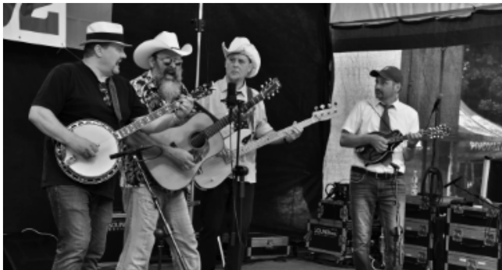
Vítěz předkola 2024 skupina Herberg