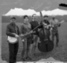
Blue Fate (DE)