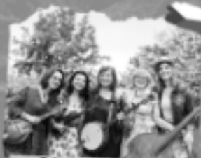
Od plotny skek (CZ)