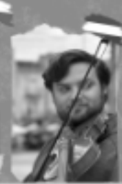
Blue Forest Pickers (NL)