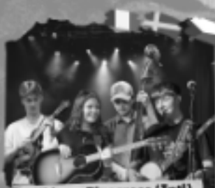
Kids on Bluegrass (Int'l)