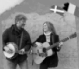
Table For Two (BE/DK)