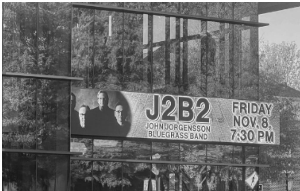
J2B2 v Cain Center in Cornelius, NC (11/8/24)

Samo mi to nepadlo do klína. Moje srdce říkalo: 'Musíš hrát bluegrass.' To je docela silný příběh."