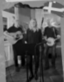
Swedish Delegation (SE)